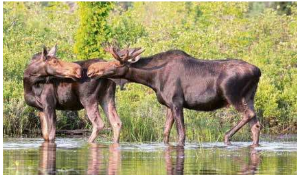
Осень у лосей – пора любви. Они одержимы инстинктом продолжить свой род – подают зов голосом: «Я здесь! Я жду тебя!» Притом молодой и старый самцы кричат по-разному.

– Ну и совсем наивный вопрос: зачем же лосю тогда рога?