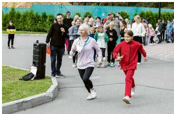
Участникам предстояло преодолеть относительно небольшую дистанцию. 1000 метров команды должны были пройти вместе и без потерь.

За соблюдением правопорядка зорко следили представители ДНД