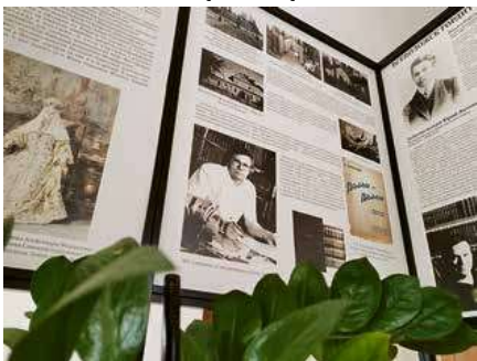
Выставка расположена в холле второго этажа Всеволожского ЦКД (Всеволожск, Колтушское шоссе, 110).

– Разобраться, почему Всеволожские – не князья, увидеть их семейное древо, выяснить, что на самом деле представляет из себя Красный замок у склона горы и каким было ближайшее прошлое города – всё это вы сможете узнать на выставке «Всеволожск: люди, места, события», – отмечают организаторы.