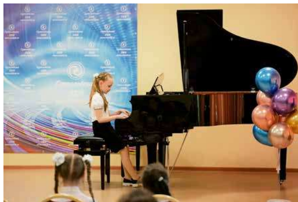
Обучение проходит по трём направлениям – в области изобразительного, музыкального и хореографического искусства.

Что касается наших ежегодных выпусков, то единого стандарта здесь у нас нет. В какой-то год это может быть 50 выпускников, в другой год – 30 и меньше. Приёмы были разные. В первый год работы школы учащихся было мало. Первоначально в её стенах учились 150–200 детей, а выпускались 10–15 человек. Сегодня, конечно, эта цифра выше. За эти годы получили свидетельство об образовании 913 способных подростков.